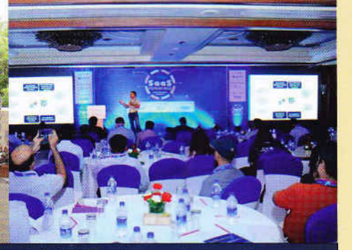
सीएडॅशबोर्ड कसं काम करतं याचं प्रात्यक्षिक

एक्सेलशीट वापरलं जायला लागलं. या दोन्ही प्रकारांमध्ये त्यांच्या त्यांच्या मर्यादा आहेत. सीएकडे काम करणाऱ्या ट्रेनी व्यक्ती (म्हणजे सीए शिकत असलेल्या किंवा कॉमर्स पदवीधारक) हे काम करतात. स्वतः सीए या रेकॉर्डच्या आधारे त्यांचं लेखापरीक्षण म्हणजेच ऑडिट करतो. त्यासाठी हे रेकॉर्ड जबाबदारीने केलेले आणि बिनचूक असणे गरजेचे असते. कोणत्याही क्लॉअंटचं असं परिपूर्ण रेकॉर्ड सीएला एका क्लीकवर बघता आलं तर ते खूपच सोयीचं होईल. शिवाय उद्योजकालादेखील आपलं हे काम किती झालेलं आहे, किती बाकी आहे याची माहिती एका क्लीकवर मिळाली तर व्यवसायिक अंदाज बांधणं, काही तरतूद करणं या दृष्टीनं सोयीस्कर होईल. सीएडॅशबोर्ड नेमकं हेच करतं. ते वापरायला सुटसुटीत तर आहेच पण सरकारी कागदपत्रांची करावी लागणारी पूर्तता या कीचकट गोष्टीपासून सीए मंडळींना आणि उद्योजकाला मोठाच दिलासा देणारं आहे. शिवाय प्रत्येक पूर्ततेसाठी आगावू सूचना मिळत असल्यामुळे सगळ्या पूर्तता वेळेत होतात, दंड, विलंबशुल्क भरावं लागत नाही.